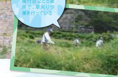
毎年、筈の川流域の鳩原や衣掛橋付近など5箇所で、草刈り作業を行っている