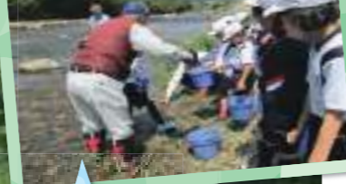
バケツに入れてもらった体長8~10センチほどの稚アユを放流する小学生たち