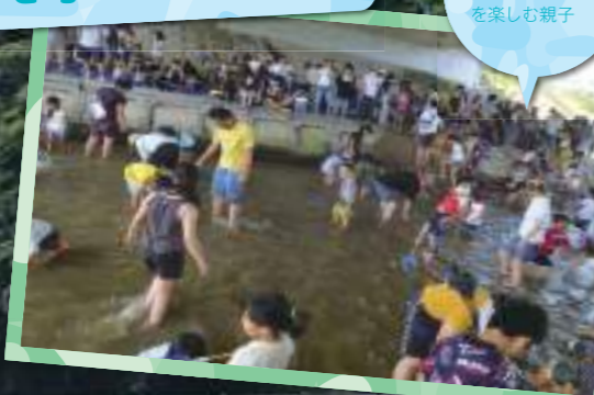
さかな観察会でアユの掴み取りを楽しむ親子