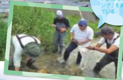
春と秋の2回、水生生物調査「生物モニタリング」を実施している