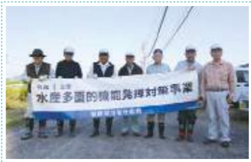
「敦賀河川を守る会」結成8周年を迎え、活動の成果も見えてきた。写真は令和1年度の河川清掃の計画・打ち合わせに集まった会員の皆さん