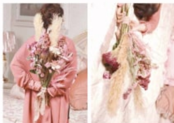
04 オーダードライフラワー花束 ¥11,000 with Tax

[3] フランス人アーティストのヴァレリーカサドの作品はすべて一品ものデザインがそれぞれ違うのが魅力です。レースや花柄が多く、ピンク色のレースやリボンをモチーフして模様が描かれます。彼女のその時のインスピレーションによって作り出される模様はどれもテーマ性なものばかりです。Valerie Casadoヴァレリーカサドは、手作りのアーティストアットタビの作家です。機械でつくられたような綺麗な完成されたものではないことをご了承の上でご注文ください。