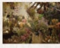
04 常に100種類以上のドライフラワーが揃う 名産のドライフラワー専門店

名古屋千種区 ドライフラワー専門店LYRICAL TEL: 052-682-3100 FAX: 052-682-3100 URL: https://www.lyrical.jp Instagram: https://www.instagram.com/lyrical_official/