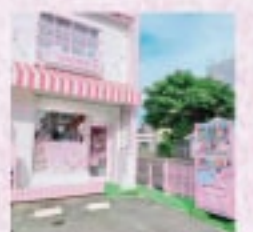
02 ハンドメイドファンシー SHOP

名古屋千種区 anora におこし TEL: 052-682-3100 FAX: 052-682-3100 URL: https://www.anora.jp Instagram: https://www.instagram.com/anora_official/