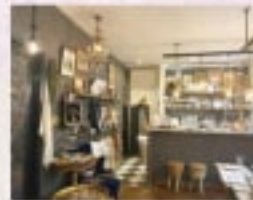
03 フランス雑貨とアンティーク雑貨のお店。

名古屋千種区 Maison de Lalan TEL: 052-682-3100 FAX: 052-682-3100 URL: https://www.maison-de-lalan.com Instagram: https://www.instagram.com/maisonde_lalan/