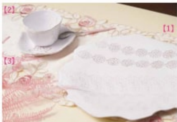
03 [1]Valerie Casadoヴァレリーカサド ワンプレート [2]Valerie Casadoヴァレリーカサド プチマダ [3]Valerie Casado ヴァレリーカサド Ramequin rouge

ぬいぐるみは全てお店で1点、1点作っています。一番人気のユニコーンのぬいぐるみは大きいサイズからミニサイズ、バージョン違いなど色々な種類があります。全て手作業で作成しているためタイミングによってはないこともあります。事前に店舗までお問い合わせください。