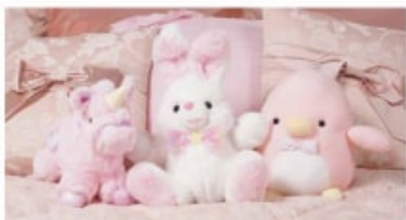
02 ユニコーンぬいぐるみ うさぎぬいぐるみ ペンギンぬいぐるみ

オリジナルのローズスリボンレースがかわいいうエルショップ限定の白家具【チェレスタ】シリーズ。上品で落ち着いたカラーと上品なシルエットが人気のシリーズです。既設する国内自社工場で作成しており、送料から仕上げまで個人による手作業で丁寧にお届けしております。