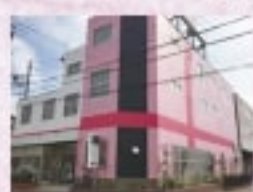
01 輸入家具・インテリア雑貨 オリジナル家具・オーダー家具

名古屋千種区 Re-L SHOP (リールショップ) TEL: 052-682-3100 FAX: 052-682-3100 URL: http://www.re-shop.jp Instagram: https://www.instagram.com/re_shop/