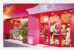
05 名古屋で老舗のランジェリーショップ インポートファッションも取り扱い中

名古屋千種区 Juniko's body shop TEL: 052-682-3100 FAX: 052-682-3100 URL: https://www.junikosbodyshop.com Instagram: https://www.instagram.com/junikosbodyshop/