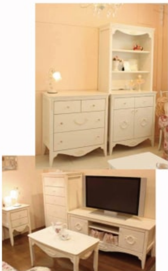
01 チェレスタ 80 アッパーシェルフ(上置き) Celesta チェレスタ 80 ローボード(キャビネット) チェレスタ 130TVボード

オリジナルのローズスリボンレースがかわいいうエルショップ限定の白家具【チェレスタ】シリーズ。上品で落ち着いたカラーと上品なシルエットが人気のシリーズです。既設する国内自社工場で作成しており、送料から仕上げまで個人による手作業で丁寧にお届けしております。