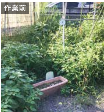
作業前 よい土を入れているため、雑草もすくすくと成長し、畑を覆い尽くした