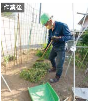
作業後 天田の作業ですっかりキレイに

記録的な暑さで知られている群馬県伊勢崎市。その日差しを受け、ぐんぐん伸びる雑草の除草作業に、天田歴史カッ トデザイナーがうかがいました。ご近所の方々、ほかの業者に除草を依頼しているけど、ウチの庭がいちばんキレイで長持ちするみたい。どこに頼んでいるの?とよく聞かれるんですよ。ご依頼主のH様は言います。天田が担当して9回目、お庭の様子は熟知しています。丁寧な作業ですっきりきれいになるので、また次も指名しようと思ってくださいのだから。