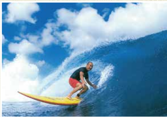
プロサーファーとして活躍していたころ。サーフィン専門誌「ON THE BOARD」掲載写真

〔植木カットデザイナー「三ツ星制度」★一ツ星評価要件〕当社契約5年以上、顧客満足度80%以上、接客、技術、安全の分野において所定の試験に合格した者