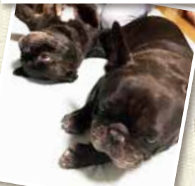
愛犬のブルドッグ「ノロ」と「ボン」