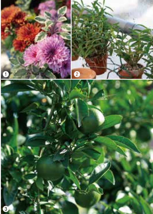
①色とりどりのマム(洋菊 オランダ品種) ②今も遺された石斛(セッコク ラン科)を大切に育てています ③熟すのが楽しみなたくさんのミカン ④毎日40分かける水やり