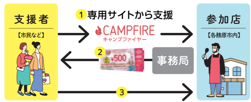
「このまち応援チケット」利用の流れ

支援者の募集は5月9日(月)～6月3日(金)。商品券の利用期間は6月24日(金)～9月22日(木)までです。この機会に、ぜひ地元の大好きな店を、お得に応援しましょう!