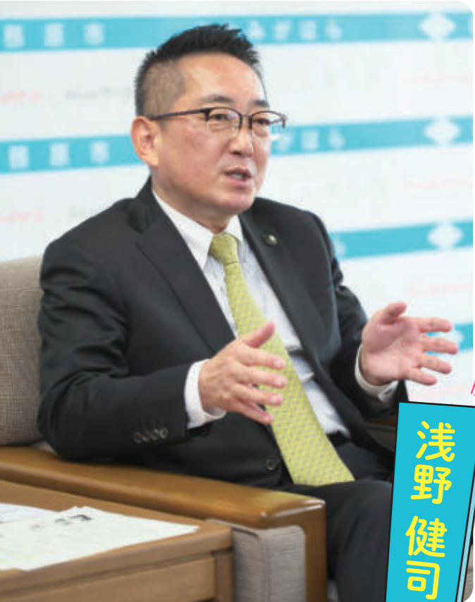
浅野 健司 市長

浅野 健司 Kenji Asano 1972年、各務原市蘇原瑞穂町出身。自動車ディーラーでの勤務を経て、2001年に各務原市議会議員選挙に初当選。3期12年務め、議長、副議長、常任委員長などを歴任した後、2013年に各務原市長選挙に初当選。現在3期目。