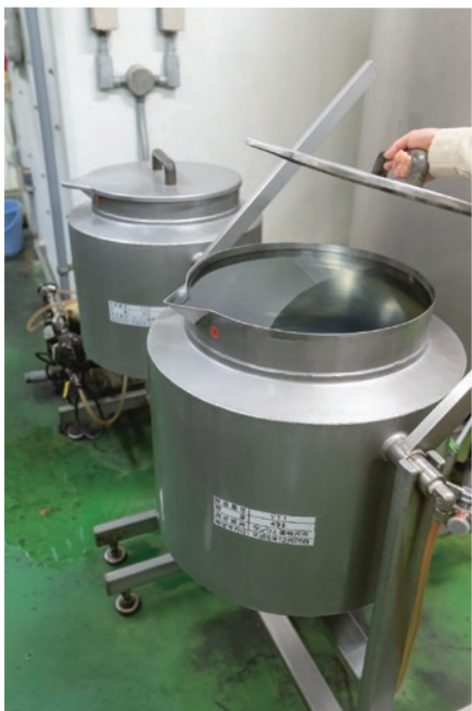
酵母は状態を見て再利用。このタンクで回収した酵母をふるいにかけ、無菌水で表面の汚れを取っていく。かなり繊細な作業だ。

今や約40もの醸造所を構える北海道のクラフトビール界において、先駆けと言えるのが北見市にある「オホーツクビール」だ。来年30周年を迎える歴史の始まりは1987(昭和62)年まで遡る。初代代表取締役の故水元尚也氏を含む地元有志一行が視察のためドイツを訪れた際、大小に関わらずこの町にもパブブルワリーがあることを知り、北見でも実現できるのではないかと考えたことがスタートに。早速翌年「北見ビール研究会」を立ち上げ動き始めるが、年間2000klという最低製造数量が壁になり、計画は暗礁に乗り上げてしまう。どうにかできないかと模索を続けていく中、1994(平成6)年、酒税法の改正により製造数量が60