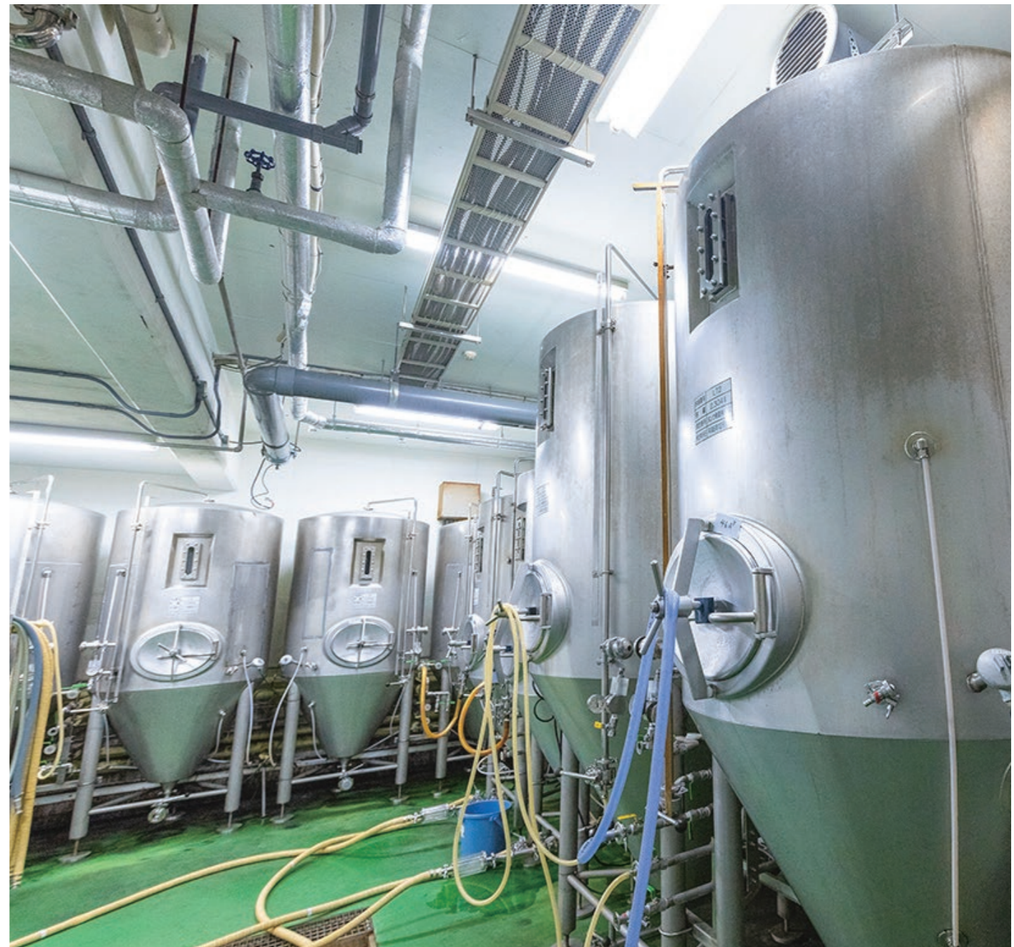
16基のタンクを上面発酵と下面発酵で使い分ける。5〜7日で主発酵が終了した段階の若ビールを貯酒タンクへ移動させ、ビールのタイプによって3週間〜3カ月程度、後発酵させる。

今は来年3月に迎える30周年を記念したアニバーサリービールを開発中だ。29周年の記念ビールは、コク・苦み・ホップを引き立たせたリッチな味わいだったが、節目となる30周年はどんな味になるか楽しみは尽きない。