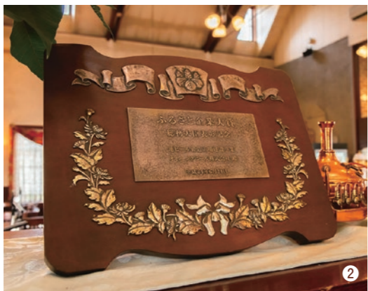
1.再利用のため回収した酵母は、増殖具合や形状を確認するため目視でカウント。汚染を防ぐため、とても重要な作業だ。2.平成14(2002)年には、地域の振興・地域経済の活性化と、魅力あるふるさとづくりの推進に資する企業に表彰される「ふるさと企業大賞(総務大臣賞)」を受賞。