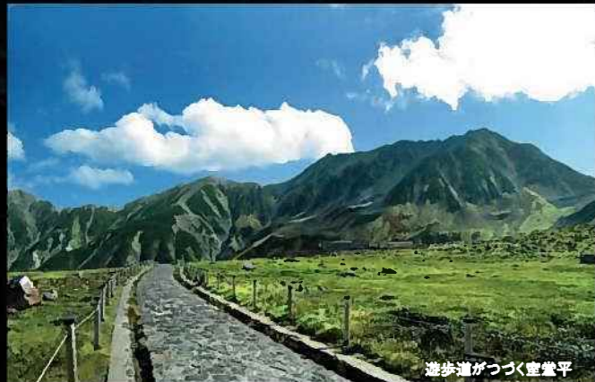
遊歩道がつづく室堂平

室堂平から雄山へ向う約2.5kmの登山道。岩が多くなり登りもキツくなり、登山者で混み合っています。