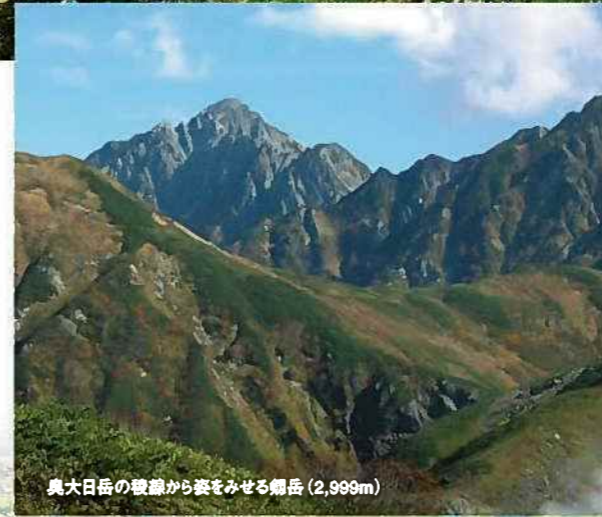
奥大日岳の鞍部から姿をみせる剣岳(2,999m)

弥陀ヶ原と大日平湿原群ラムサール条約2012年登録地上とは隔絶された広大な溶岩台地、言わずと知れた「天空に広がる大草原」です。長くつづく木道を辿り、高山地帯特有の植生が観察できます。夏には、ガキの田と呼ばれる小池が点在し、可憐な高山植物が咲き誇る至高のトレッキングルートです。