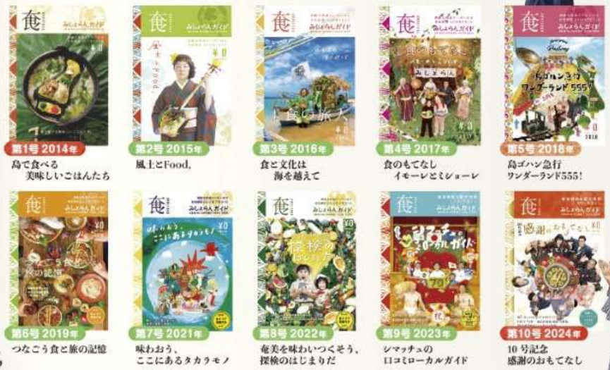
第1号 2014年 島で食べる 美味しいごはんたち 第2号 2015年 風上とFood, 第3号 2016年 食文化は 海を越えて 第4号 2017年 食のもてなし イモレとミシヨレ 第5号 2018年 島ゴハン急行 ワンダーランド555! 第6号 2019年 つなごう食と旅の記憶 第7号 2021年 味わおう、ここにあるタカラモノ 第8号 2022年 奄美を味わいつくそう、探検のはじまりだ 第9号 2023年 シマツチュの 口コミローカルガイド 第10号 2024年 10号記念 感謝のおもてなし